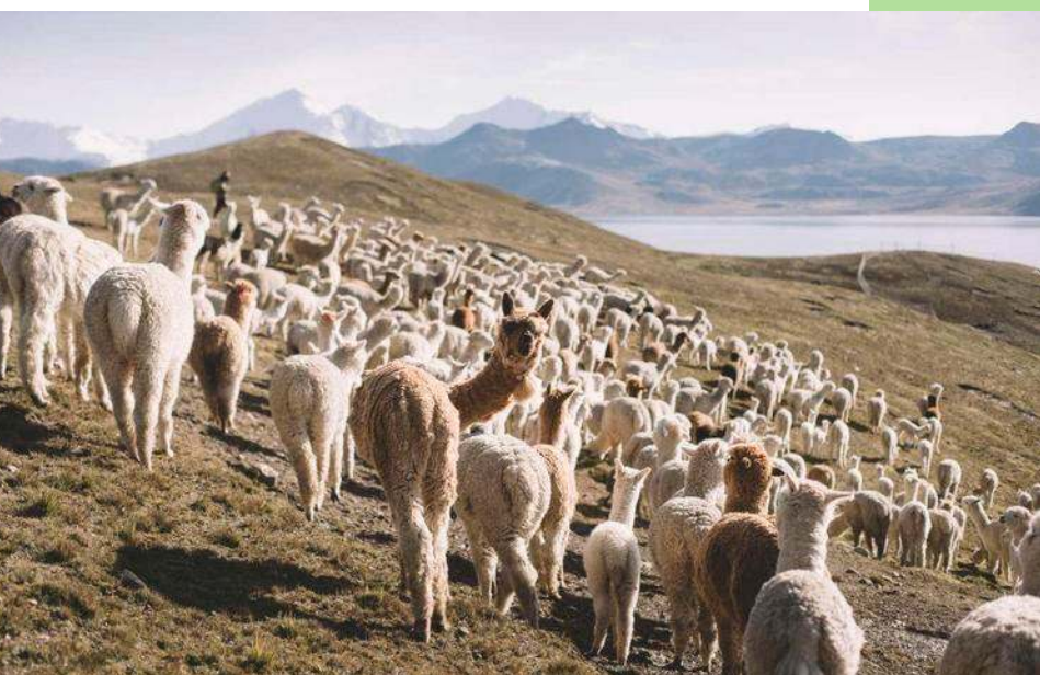
Ilustración de la cría de alpacas en Perú.

MG, Courrier international , n°1660 del 25 al 31 de agosto de 2022