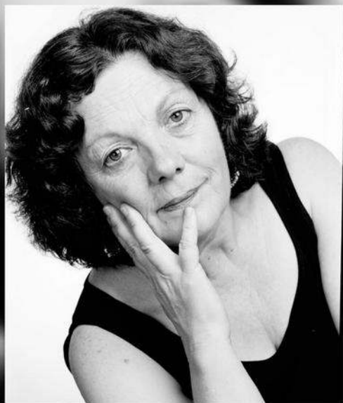
Fotografía en blanco y negro de Graciela Iturbide.

A.F Courrier International - n°1632 - del 10 al 16 de febrero de 2022