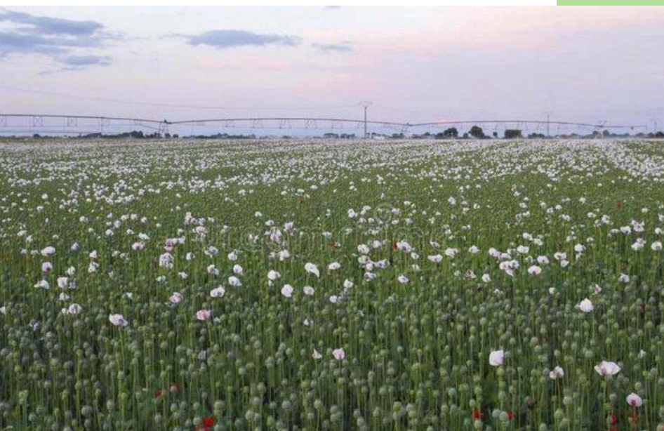
Foto de un campo de amapolas en España, en la primavera.

S.GA Courrier International n°1658 17 de Agosto de 2022