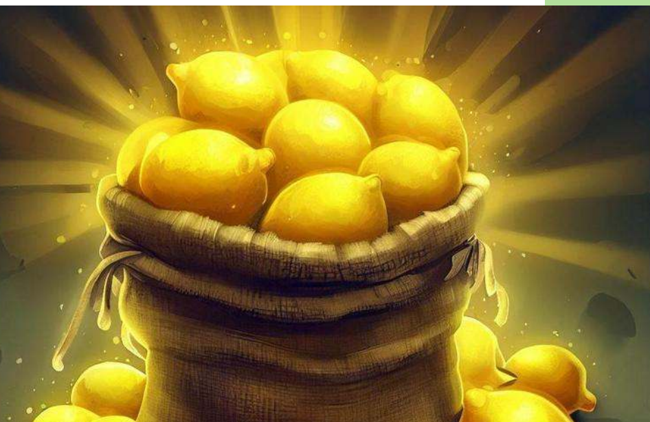
Limones de oro, para representar la subida de los precios

(Courrier International N°1721, 30/10/23)