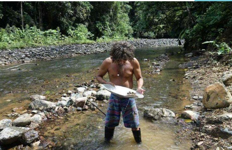
Un hombre, buscando oro en un río.

( Courrier International, N°1723, del 9 al 15 de noviembre 2023)