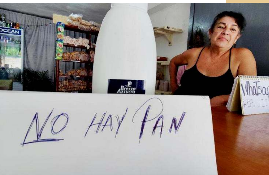
Una tienda de La Habana cuelga el letrero de «no hay pan» ante la imposibilidad de comprar harina.

(24 de febrero de 2024 "courrier international" n°25)