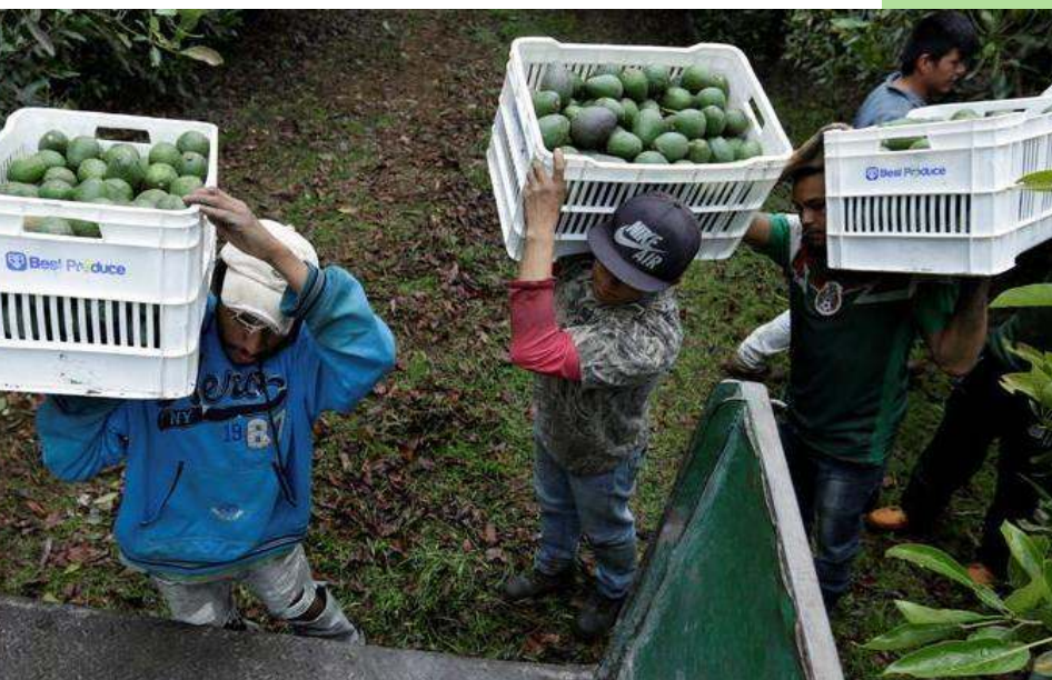
Los trabajadores agrícolas del estado de Michoacán, llevan cajas de aguacates recién cosechados .

( Courrier International, N°1739: del 29 de febrero al 6 de marzo de 2024)