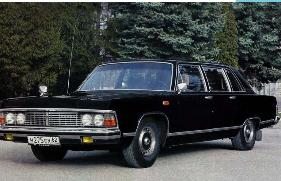
Una limusina GAZ 14 Tchaïka

(Courrier International, 7 al 13 de marzo de 2024)