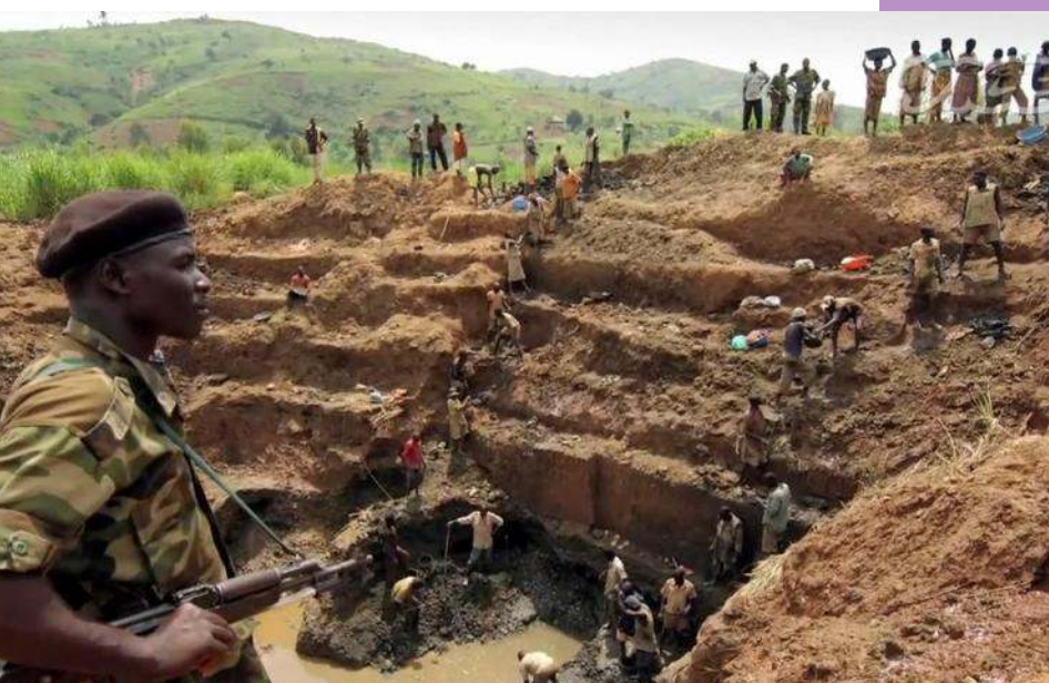
Grupo de traficantes armados que obligan a la población local a extraer coltán