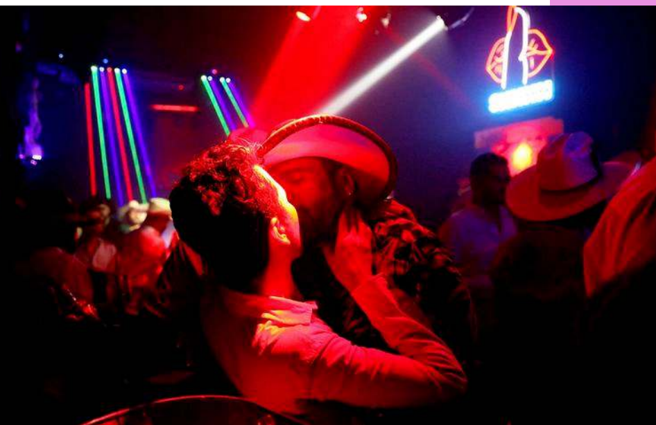
Dos vaqueros gays en una discoteca de Zacatecas, en México.

(Courrier international, N°1707-08-09, 20 juillet 2023)